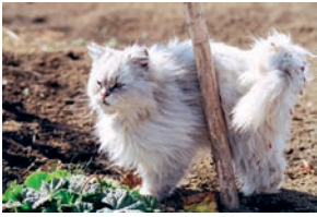
2月 埼玉のもしゃもしゃ猫